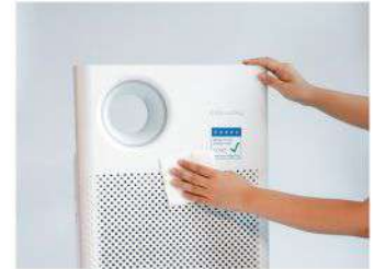
Pembersihan Bagian Luar

*Remark) For reasons not responsible for the customer during the monthly payment contract, if the product is broken, damaged or lost, we will repair and replace parts free of charge. But if your monthly payment is overdue or unpaid, your service may be stopped.