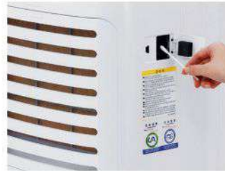
Pemeriksaan Sensor Tingkat Polusi