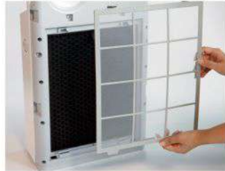
Pengganti Filter secara Periodik